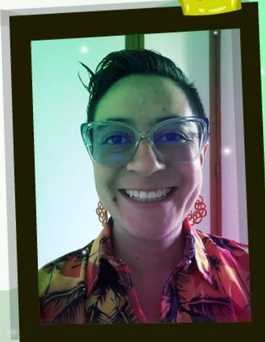
Maestra en Artes Escénicas Énfasis en Actuación Universidad El Bosque

Se incrementarán habilidades comunicativas y expresivas desde el lenguaje del cuerpo, experimentando con un humor que privilegia el gesto y reconoce en la repetición un camino para la creación.